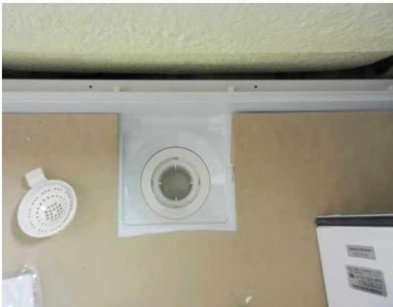
ユニットバス排水トラップ付き