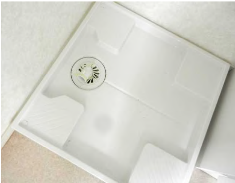
洗濯パン排水トラップ付き