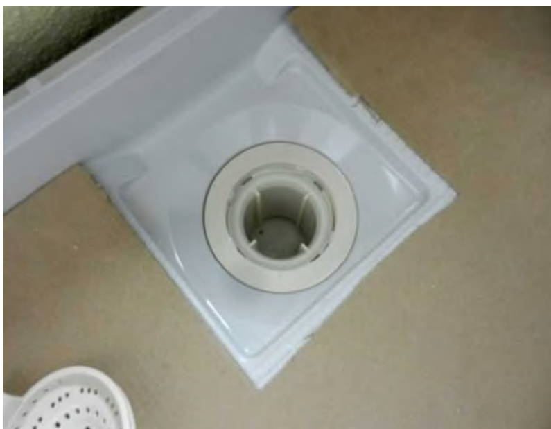
ユニットバス排水トラップ付き