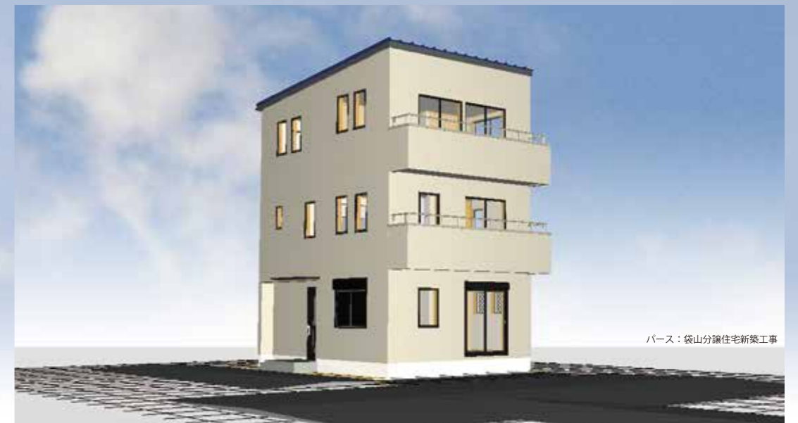
パース：袋山分譲住宅新築工事